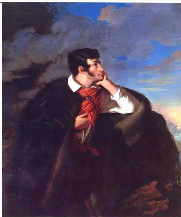
Walenty Wańkiewicz, Portret Adama Mickiewicza na Judahu skale , 1827–1828, źródło: Wikimedia Commons, domena publiczna