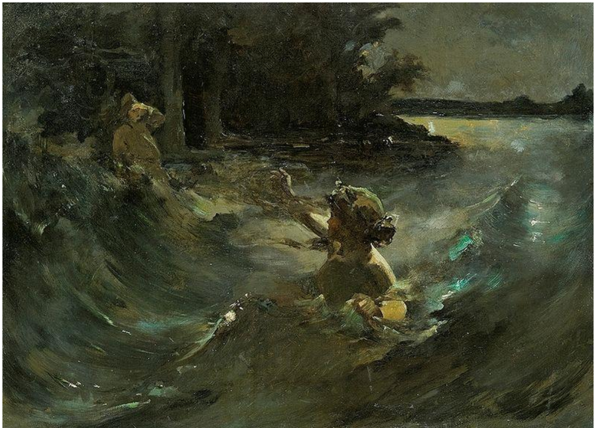
Kazimierz Alchimowicz, Świtezianka , między 1898 a 1900