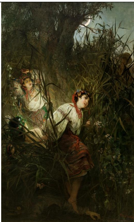
Witold Pruszkowski, Rusalki , 1877